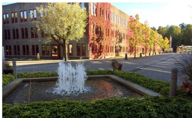
SITE ligger i Farsta, Telestaden

Nordic Circle of Artistic Management är ett tre-årigt kompetensutvecklande projekt som består av ett mentorskapsprogram för dansproducenter och självproducerande koreografer baserade i Norden, samt öppna workshops. NCoAM stöds av Nordic Culture Point, Nordic Culture Fund, Danish Arts Foundation, Finish Arts Promotion Centre och Kulturrådet. Projektet drivs i samarbete mellan SITE, Projektcentret i Dansehallerne (DK), Performing Arts Hub Norway, Arts Management Helsinki och Dance Atelier (IS). Läs mer här .