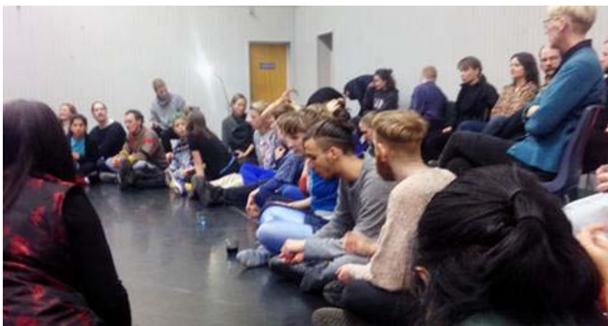
Dance Concerts har varit välbesökta happenings i SITE Studio

Tack! Thank You! Gracias! Till alla som kom, till de medverkande och till våra medarrangörer!