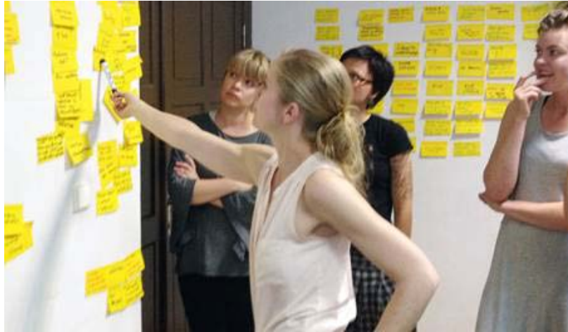
Workshop och planering inför Mentoringprojektet i kedja Mariehamn