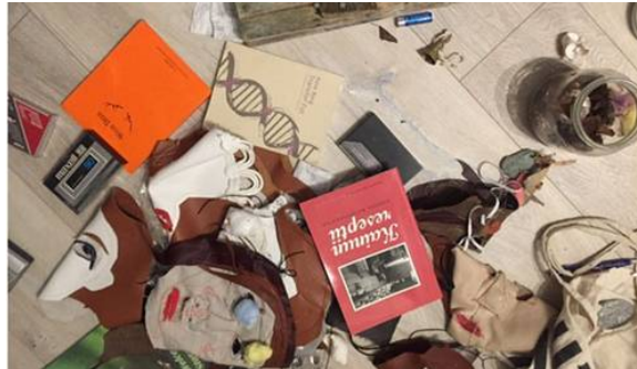
We Insist ©Mia Habib/Jassem Hindi