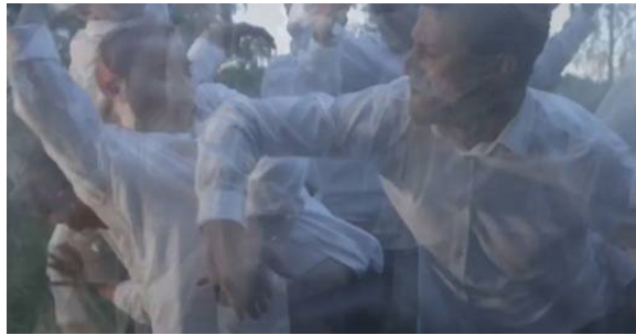
Som man sår, från Unga Klaras trailer