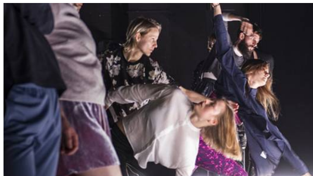
A Line_up

SITE passar på att gratulera Unga Klara till att de blir nationell Scen för barn- och ungdomsteater - den första scenen i Sverige med ett renodlat barn- och ungdomsuppdrag att erhålla status som nationell institution!