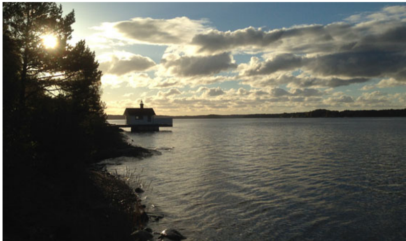
Bastun på Tynningö, foto Tina Eriksson Fredriksson