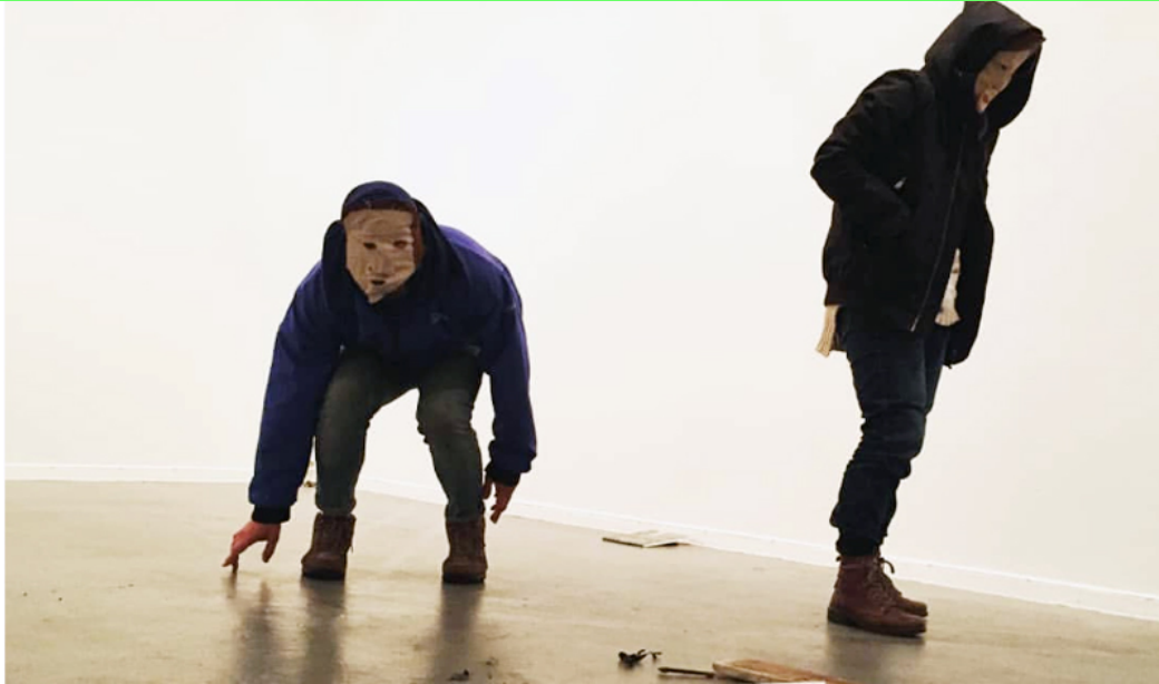
STRANGER WITHIN