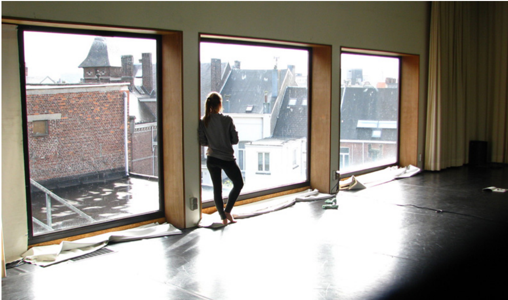
THE EVENT HORIZON PRACTICE

Tidigare SITE-stipendiaten pavleheidler och kollektivet Together Alone gör en provföreställning av THE EVENT HORIZON PRACTICE för första gången inför publik den 7 december. THE EVENT HORIZON PRACTICE tar upp och undersöker begreppet utmattning i ett försök att skapa dans som är meningsfull och nödvändig och där dansen är en livskraftig form av kommunikation och kunskapsutbyte. Föreställningen ingår i Together Alones serie av experimentella performativa dansmetoder som de kallar THE CELESTIAL BODY.