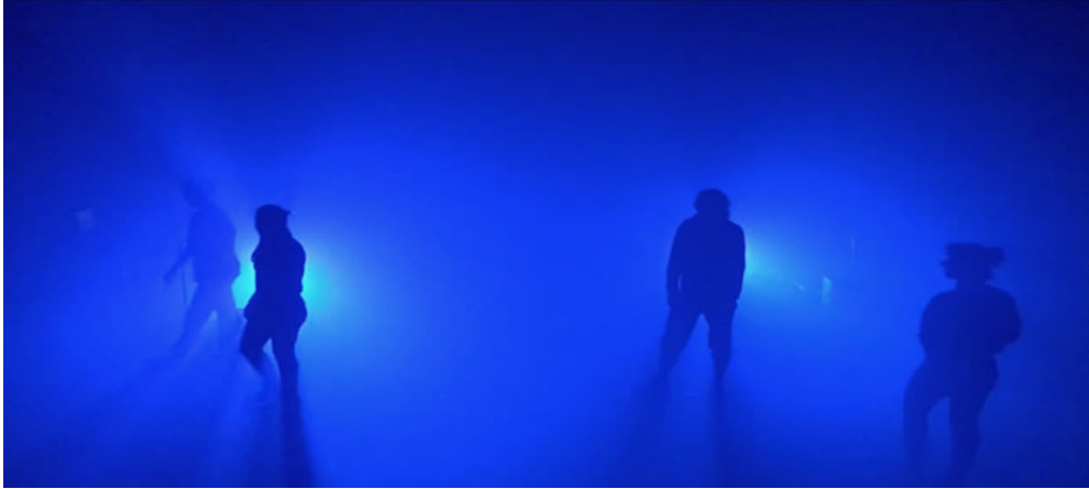
PUNKS NOT DEAD

SITE-stipendiaten Nefeli Oikonomous föreställning PUNKS NOT DEAD visas på Dansmässans utbudsdag som äger rum på SITE och i Hallen i Farsta den 7 november.