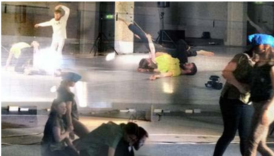
The Moon Practice av TOGETHER ALONE