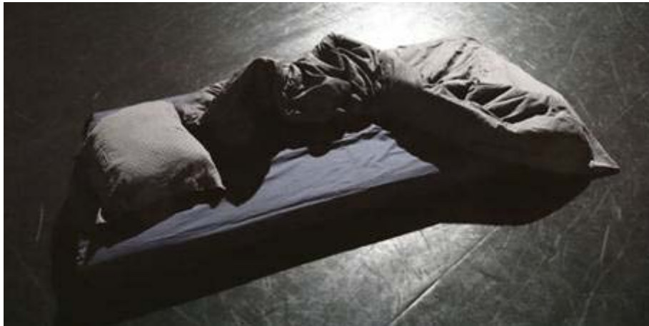
Falling på Weld